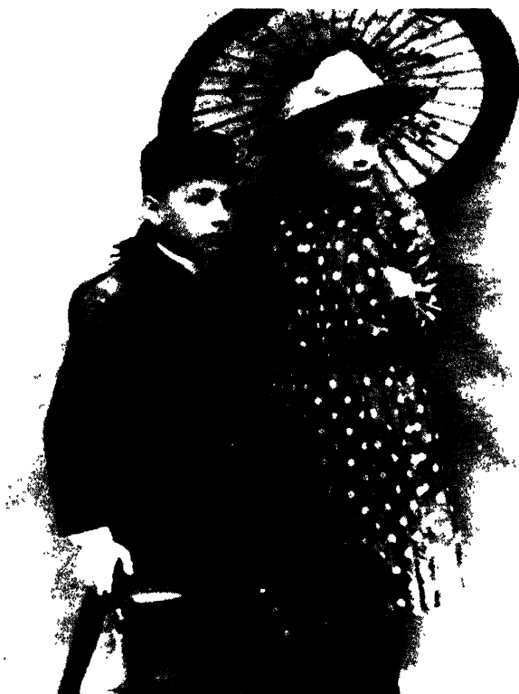
अलबर्ट आइंस्टीन अपनी बहिन माजा के साथ

बिल्कुल मौलिक व्युत्पत्ति ढूँढ़ निकाली। परिणाम मिल जाने पर वह बालक प्रसन्नता से भर जाता था, उस समय तक वह समझ चुका था कि उसकी प्रतिभा उसे किस दिशा में ले जा रही थी।”